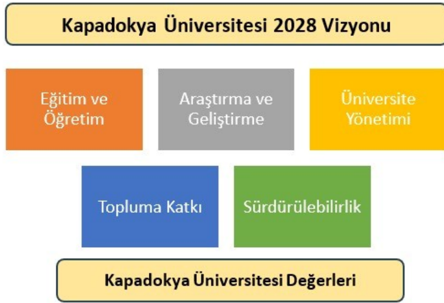
Şekil 2. Kapadokya Üniversitesi Stratejik Planının Yapısı

https://www.kapadokya.edu.tr/hakkimizda/stratejik-plan