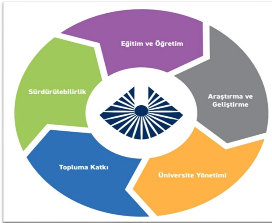
Şekil 2: Kapadokya Üniversitesi Stratejik Planının Yapısı

Kapadokya Üniversitesinin 2023-2028 dönemini kapsayan Stratejik Planı, 2018-2023 Stratejik Planının uygulanmasından elde edilen sonuçlar ve izleyen döneme yönelik amaç ve hedefler ışığında oluşturulmuştur. Bu dönemin Stratejik Planı, beş stratejik alan üzerine inşa edilmiştir. Bu stratejik alanlar Eğitim ve Öğretim, Araştırma ve Geliştirme, Üniversite Yönetimi, Topluma Katkı ve Sürdürülebilirlik şeklinde belirlenmiştir. Stratejik alanların her biri stratejik amaçlar ve her bir amaçta kendine özgü stratejik hedefler kapsamaktadır. Bu amaç ve hedefler, BM Sürdürülebilir Kalkınma Amaçları (SKA) ve ulusal/yerel kalkınma planları ile uyumlu olacak şekilde belirlenmiş, üniversitemizin topluma ve kalkınma amaçlarına sunacağı katkının en üst düzeyde gerçekleşmesi hedeflenmiştir.