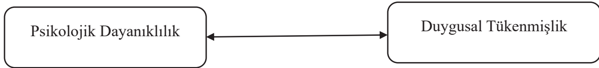
Şekil 1. Araştırma Modeli

Psikolojik dayanıklılık ile duygusal tükenmişlik arasındaki ilişkiyi incelemek üzere, anket tekniği kullanılarak elde edilen örneklem vasıtasıyla ve ilişki tarama modeliyle tasarlanan bu çalışmanın model olarak gösterimi ve bu model çerçevesinde öngörülen hipotezi aşağıdaki gibidir: