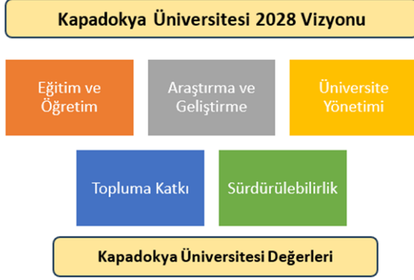
Şekil 2. Kapadokya Üniversitesi Stratejik Planının Yapısı

https://www.kapadokya.edu.tr/hakkimizda/stratejik-plan