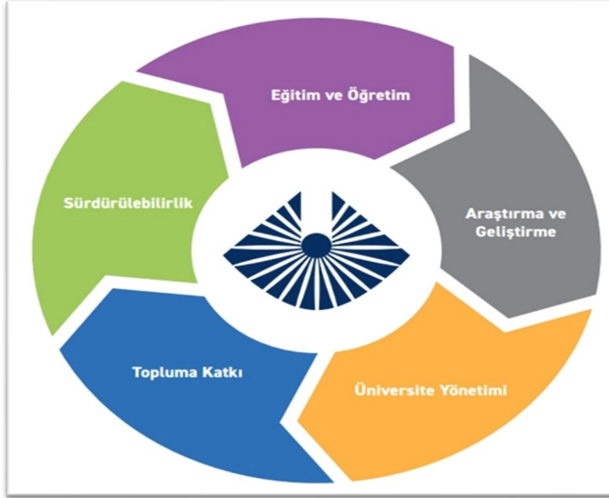
Şekil 2: Kapadokya Üniversitesi Stratejik Planının Yapısı

Sürdürülebilirlik şeklinde belirlenmiştir. Stratejik alanların her biri stratejik amaçlar ve her bir amaçta kendine özgü stratejik hedefler kapsamaktadır. Bu amaç ve hedefler, BM Sürdürülebilir Kalkınma Amaçları (SKA) ve ulusal/yerel kalkınma planları ile uyumlu olacak şekilde belirlenmiş, üniversitemizin topluma ve kalkınma amaçlarına sunacağı katkının en üst düzeyde gerçekleşmesi hedeflenmiştir.