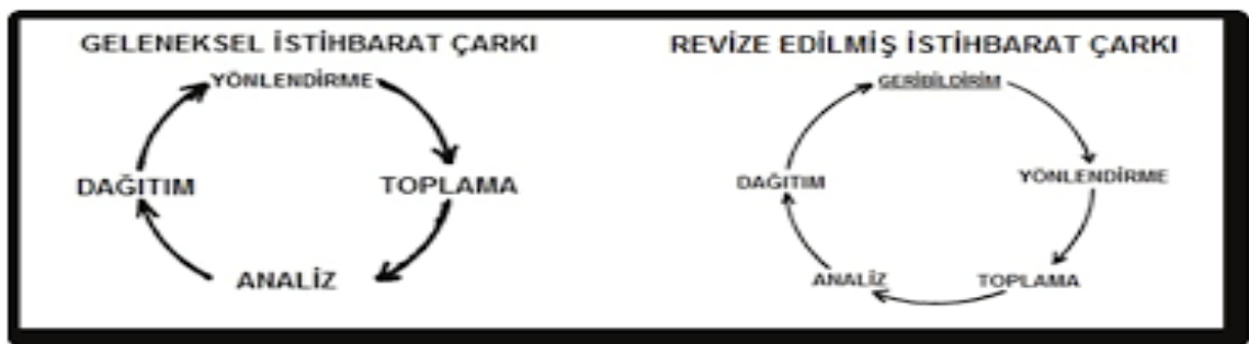
Şekil 3. Geleneksel ve Revize Edilmiş İstihbarat Çarkları (BULUT, 2017, s. 84).

İstihbarat çarkı, bilginin istihbarata dönüştürülüp kullanılabilir düzeye gelmesini sağlayan çok aşamalı bir işleme sürecini ifade etmektedir. Bu süreç kesintisiz olarak devam eder ve başladığı noktaya her seferinde geri döner. Bu yüzden sürece, çark yakıştırması uygun görülmüştür (Kavsıracı & Demirbaş, 2020, s. 49-64).