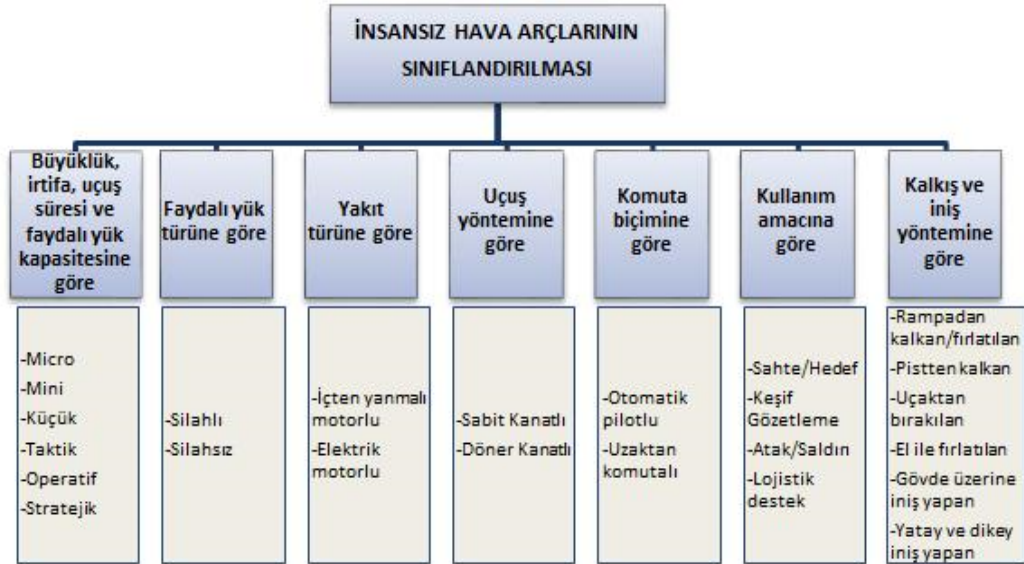
Tablo 2. İnsansız Hava Araçlarının Sınıflandırılması (Selek, & İncekara.,2018, s. 147).

birtakım silah sistemleri monte edilmek suretiyle muharip özellik kazandırılmakta ve SİHA ismiyle yeniden sınıflandırılmaktadır (Aksan, 2020).