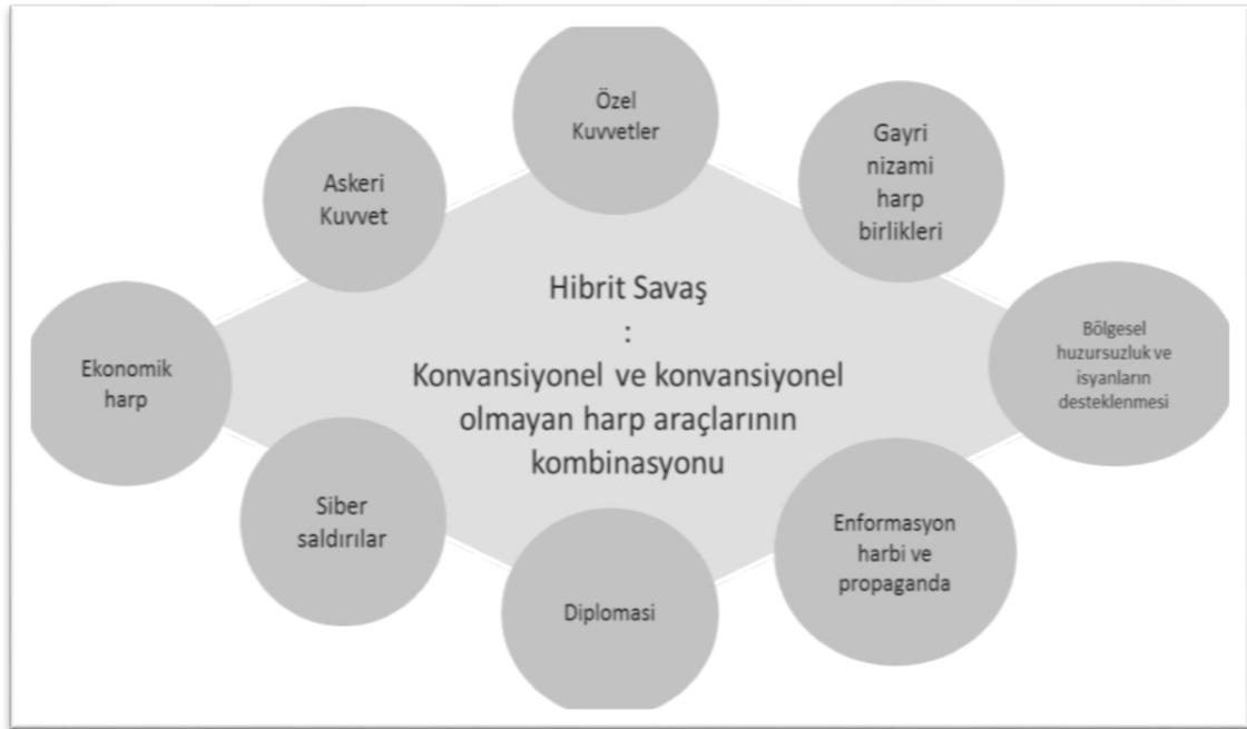
Tablo 1. Hibrit Savaş Elemanları(Pınarer, 2020).