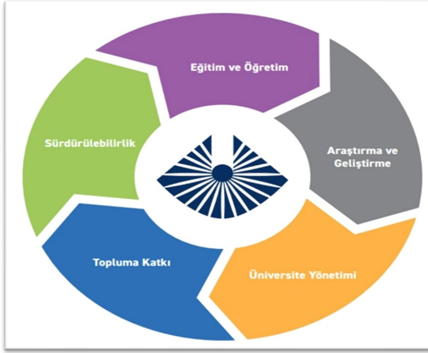
Şekil 2: Kapadokya Üniversitesi Stratejik Planının Yapısı

Kapadokya Üniversitesi stratejik planında Fizyoterapi programının dahil olduğu stratejik amaç, hedef ve performans göstergeleri okulumuz web sayfasında verilmiştir.