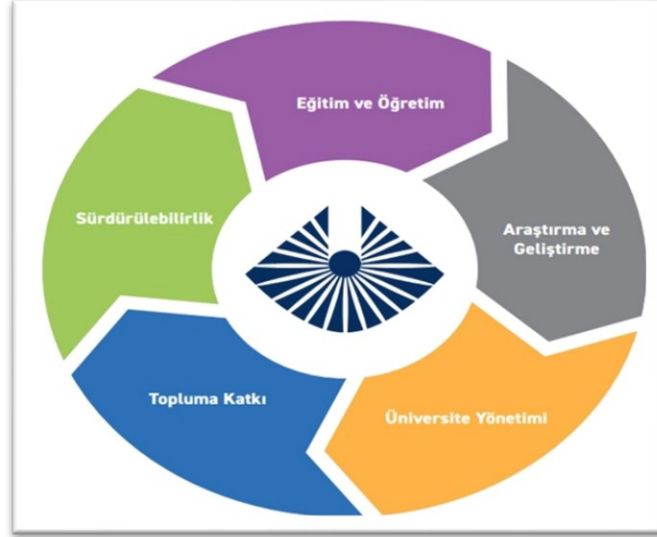
Şekil 2: Kapadokya Üniversitesi Stratejik Planının Yapısı

alanlar Eğitim ve Öğretim, Araştırma ve Geliştirme, Üniversite Yönetimi, Topluma Katkı ve Sürdürülebilirlik şeklinde belirlenmiştir. Stratejik alanların her biri stratejik amaçlar ve her bir amaçta kendine özgü stratejik hedefler kapsamaktadır. Bu amaç ve hedefler, BM Sürdürülebilir Kalkınma Amaçları (SKA) ve ulusal/yerel kalkınma planları ile uyumlu olacak şekilde belirlenmiş, üniversitemizin topluma ve kalkınma amaçlarına sunacağı katkının en üst düzeyde gerçekleşmesi hedeflenmiştir.