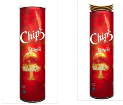
Resim 5. Silindirik gıda ambalajı 3ds max çizimi

Ambalajın insan sağlığına zararsız ve geri dönüştürülebilir kâğıt malzemeden üretilerek çevreye duyarlı bir tasarım olması planlanmıştır. Tasarlanan prototipte silindirik kutunun iç taban kısmına 30 mm çapında, 1mm kalınlığında ve 230 mm yüksekliğe sahip çelik malzemeden üretilmiş yay ve kullanılan yaya 2 mm kalınlığında 80 mm çapında mukavva platform yerleştirilmiştir. Taban kısmına yerleştirilmiş bu hassas yay ile tüketilen miktar kadar gıda ambalajın içerisinde yükselmektedir (Resim-6).