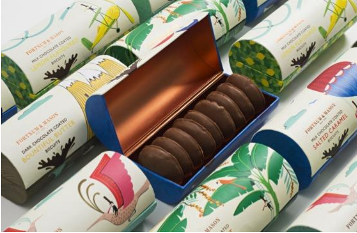
Resim 3. Silindir formunda çikolata ambalajı

Silindir ya da tüp formundaki ambalajlar günümüzde gıda sektöründe bisküvi, çerez, cips gibi ürünlerde sıklıkla kullanılmaktadır. Bu tür ambalajlarında tüketici gıdayı ambalajından çıkartma ve tüketmekte sorun yaşamaktadır. Bu sorun ambalaj tasarımcıları tarafından çeşitli şekillerde çözülmeye çalışılmaktadır. Örneğin Resim-3'te görülen silindir formundaki çikolata ambalajında enine doğru açılan bir sistem kullanılarak ürüne erişim kolaylaştırılmış hem de bir sunum formatı oluşturulmuştur.