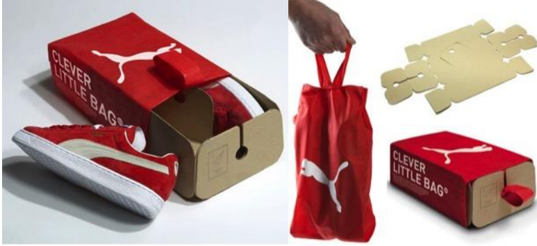
Resim 2. Puma Clever Little Bag konseptli ambalaj tasarımı

Dış ambalaj olarak geri dönüştürülmüş plastikten yapılmış bir çanta kullanılarak hem de %65 oranında daha az karton kullanılmış, hem de ambalajın tüketici tarafından daha sonrada farklı konseptlerde kullanması sağlanmıştır.