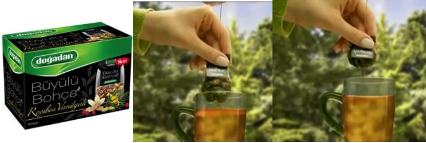
Resim 1. Doğadan poşet çay reklam filminden ekran görüntüleri

Markalar ambalajın renk, illüstrasyon tipografi gibi görsel unsurlarının yanı sıra işlevsel kolaylığı sağlayacak olan biçimsel özellikleri de düşünmek zorundadırlar (Hassenzahl, 2003; Hassenzahl ve Tractinsky, 2006; Effie, Roto, Hassenzahl, Vermeeren ve Kort, 2009). Hassenzahl tasarımın özelliklerinin kullanıcı deneyimini nasıl etkileyeceği konusunu şöyle açıklar; kullanıcı deneyimi, ürünün özelliklerine bağlı olarak zevk ve tatmin gibi unsurların ortaya çıkmasıdır. Bu özellikler kullanımı etkileyen eyleme dair pragmatik özellikler ile uyarma, özdeşleşme ve çağrışım yapma gibi kişi ile ilişkili hazsal özellikler olmak üzere iki grupta toplanır (Hassenzahl, 2003). Ambalajın işlevsel özellikleri formu ile ilişkili açma, kapama, tutma, tüketme ya da boşaltma gibi eylemlerde tüketiciye kolaylık sağlamakla başlar. Formda yapılacak oldukça basit değişiklikler bile kullanım kolaylığı açısından fark yaratabilir. Resim-1’de görülen “Doğadan” marka poşet çay ambalajları bu konuda örnek olarak gösterilebilir. Çay poşetlerini tutan ip ve kâğıt bağlantısına birbirinden ayrılarak poşeti sıkma özelliği eklenerek ile tüketiciye çayın demini başka bir malzeme kullanmadan sıkma kolaylığı sağlamaktadır.