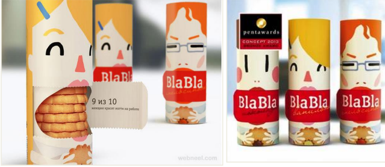
Resim 4. Silindirik formunda bir bisküvi ambalajı konsepti, Pentawards 2013 ödüllü öğrenci projesi.

kolay ulaşabilmesini sağlamanın yanı sıra eğlenceli ve mizahi bir görüntü oluşturmaktadır. Kutunun açılmasını kolaylaştırmak için malzeme olarak ince mukavva kullanılmıştır.