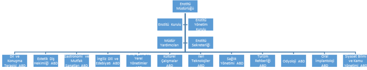
Şekil 1. Kapadokya Üniversitesi Lisansüstü Eğitim, Öğretim ve Araştırma Enstitüsü Organizasyon Şeması