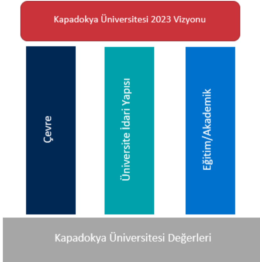
Şekil 4.7. Kapadokya Üniversitesi Stratejik Planının Yapısı

https://www.kapadokya.edu.tr/hakkimizda/stratejik-plan