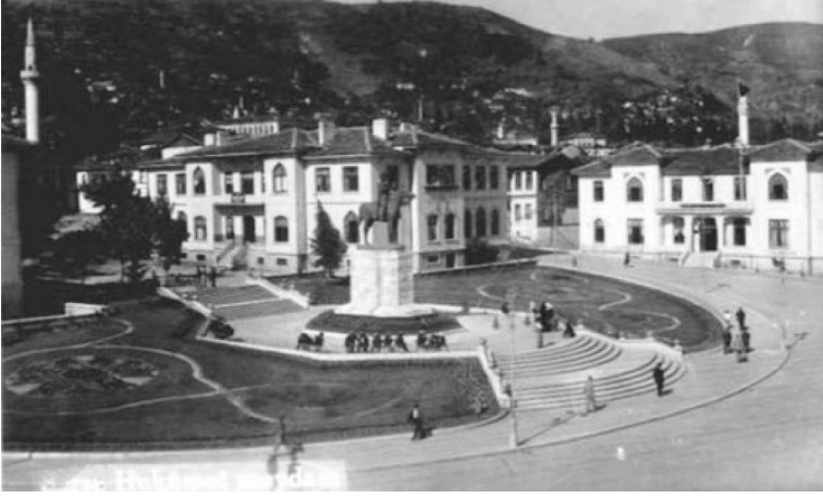
Fotoğraf 3: Atatürk Heykeli'nin sol tarafında yeni yapılan valilik binası ve adliye bulunuyor. Her ikisi de I. Ulusal Mimarlık Akımı çerçevesinde yapıldı.