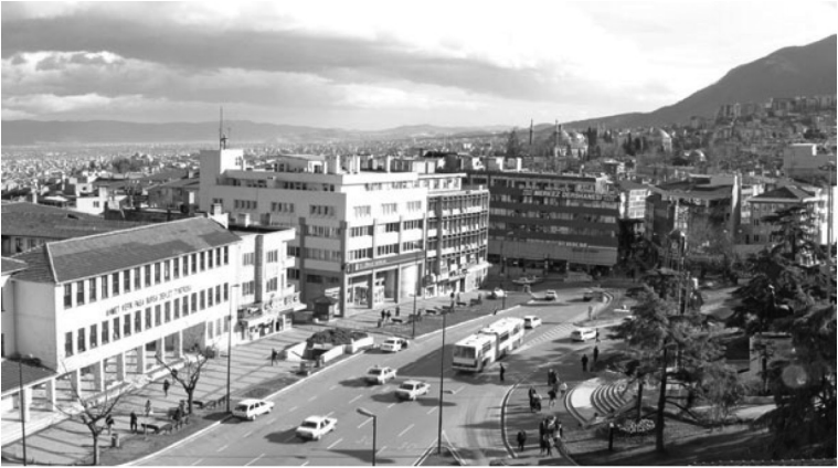
Fotoğraf 6: Atatürk Anıtı'nın karşısına modern mimari üslubuyla yapılmış binalar.

Bursa'da Cumhuriyet dönemi mimarî üsluplarının görünür olduğu diğer önemli kamusal yapılar 1930-1932 yılları arasında Giulio Mogneri ve Hüsnü Tümer'in "Modern Mimari" üslubuyla inşa ettikleri Çekirge yolu üzerindeki Çelik Palas Oteli, Bohemya kübiği olarak bilinen modern üslupla Arif Hikmet Koyunoğlu'nun 1938 yılında inşa ettiği Atatürk Caddesi'ndeki Tayyare Sineması, 1948 yılında Emin Onat tarafından II. Ulusal