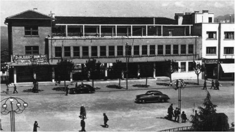
Fotoğraf 5: Yeni Halkevi ve CHP İl Başkanlığı. Daha sonra Ahmet Vefik Paşa Tiyatrosu'na dönüştürüldü.