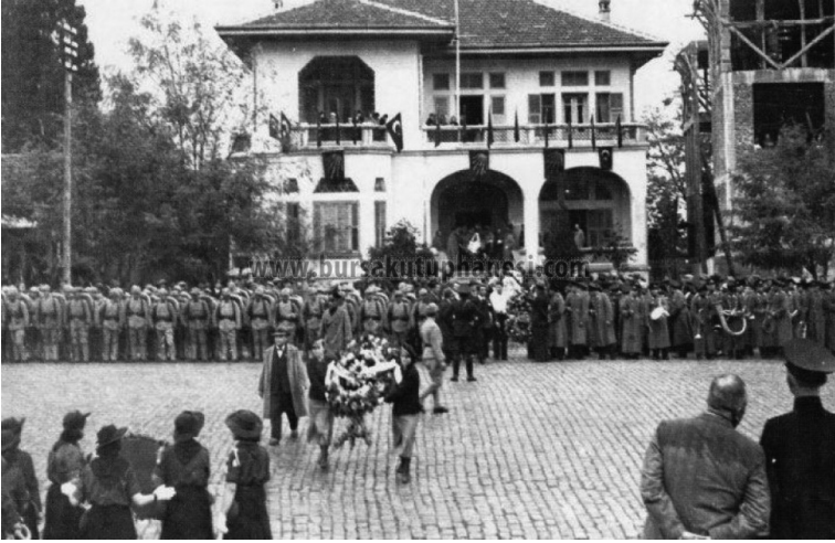
Fotoğraf 4: Atatürk Heykeli'nin tam karşısında CHP Bursa İl Başkanlığı. Yan tarafta ise modern mimari üslubuyla Münevver Belen'in projesi olan yeni Halkevi ve İl Başkanlığı binası inşa edilmekte.