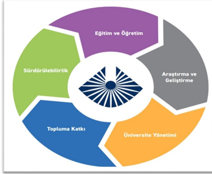
Şekil 2: Kapadokya Üniversitesi Stratejik Planının Yapısı

alanlar Eğitim ve Öğretim, Araştırma ve Geliştirme, Üniversite Yönetimi, Topluma Katkı ve Sürdürülebilirlik şeklinde belirlenmiştir. Stratejik alanların her biri stratejik amaçlar ve her bir amaçta kendine özgü stratejik hedefler kapsamaktadır. Bu amaç ve hedefler, BM Sürdürülebilir Kalkınma Amaçları (SKA) ve ulusal/yerel kalkınma planları ile uyumlu olacak şekilde belirlenmiş, üniversitemizin topluma ve kalkınma amaçlarına sunacağı katkının en üst düzeyde gerçekleşmesi hedeflenmiştir.