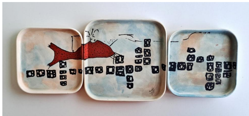
Görsel 18: Seda Özcan Özden, Lav, Hazır Bünye, Sıraltı Dekorlama, 1010 °C, 42,5 x 16,5 cm, 2024.

Çatalhöyük insanın ürettiği, çoğunlukla güzel bir şekilde dekore edilmiş, seramik malzemelerin yanı sıra obsidyen ve kemik aletler sadece geçim için değil ilginç nesnelere yaratmak için de kullanılmıştır (Çatalhöyük, n.d.). Tarihteki ilk ayna olma özelliği ile obsidyen, Özcan Özden'in " Kendine, Çatalhöyük'te Bakmak " isimli çalışmasında (Görsel 17) değişen dünyanın malzeme çeşitliliğine vurgu yaparak aynanın malzeme olarak dönüşümüne gönderme yaparken kavramsal olarak kişinin kendi silüetini ilk ne zaman ve hangi yüzeyde görebildiği temasına da odaklanmaktadır.