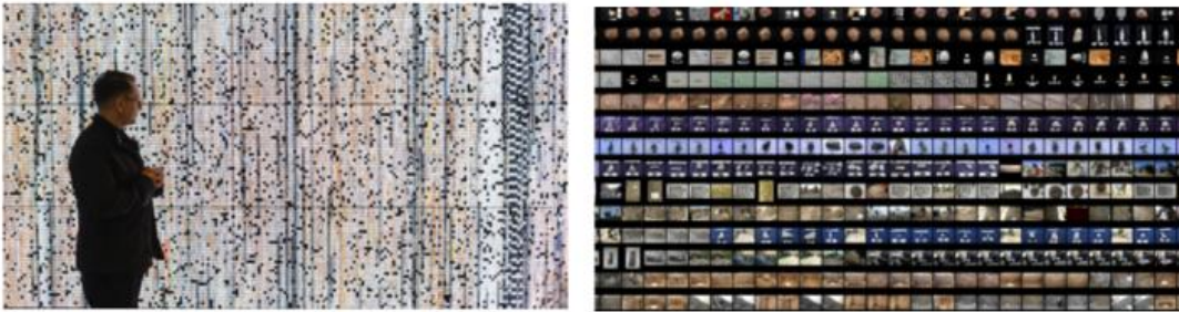
Görsel 7: Refik Anadol, Çatalhöyük Araştırma Projesi Arşivi, 2017.

Zengin veri tabanından nasıl bir değer üretilebileceği, öğrenme algoritmalarının ve makine öğrenmesinin arşive nasıl uygulanması gerektiği sorularıyla başlayan projede Refik Anadol ile birlikte stüdyoda yer alan veri bilimci, sanal gerçeklik mühendisi ve üretimsel tasarımcılardan oluşan beş kişilik bir ekip yer almaktadır. Görsel 8’de yer alan, “Kontakt baskı ( contact sheet )” sahnesi; ilk çekilen sol üstteki fotoğraftan, son çekilen sağ alttaki fotoğrafa kadar kazı evinde görev alan grupların çekim anlayışına göre kronolojik bir şekilde dizilimden oluşurken çalışmayı çizgisel bir düzlemde göstermektedir. Tarihsel olarak yapılan dizilimin oluşum sürecini Refik Anadol; “tek tek imajları bularak küçültüp bir yere yerleştirme, ardından tekrar küçültüp başka bir alana koyma ve verilen enstalasyon ölçüsüne uyumlu olarak, en sol üst köşeden en sağ alta kadar piksel piksel tekrar inceleyerek düzenleme yapmayı içeren oldukça zaman alıcı bir süreç olarak” ifade etmektedir (ANAMED Blog, n.d.).