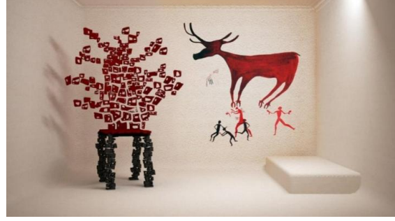
Görsel 9: Naile Çevik, Gözlem Sandalyesi Serisi I, Karışık Teknik (Linol Baskı, Elle Müdahale ve Dijital Tasarım), 2022.