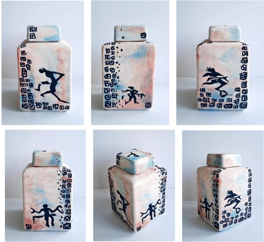
Görsel 26-31: Seda Özcan Özden, Leoparın Mimarisi , Hazır Bünye, Sıraltı Dekorlama, 1010 °C., 12 x 12 x 19,5 cm, 2024.

Özcan Özden, " Leoparın Mimarisi " isimli çalışmasında (Görsel 26-31) Çatalhöyük duvar resimlerinde yer alan leopar postu giyen insan figürünü ve kent planlarının görsellerini ilham kaynağı olarak kullanmıştır. Çatalhöyük'ün sokaksız, dar geçitli evleri aracılığı ile geometrik öğelerle vurgulanırken insan yaşamının geçmişten geleceğe katmanlanan motif dünyası leopar teması ile ortaya konulmaktadır.