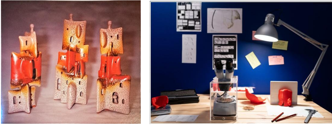
Görsel 5: Sadi Diren, İsimless, Seramik, Özel Koleksiyon, 1987.