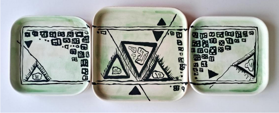
Görsel 19: Seda Özcan Özden, Görsel Kültür, Hazır Bünye, Sıralı Dekorlama, 1010 °C 42,5 x 16,5 cm, 2024.

Çatalhöyük şehir planı unsurları kompozisyonun ana tamamlayıcı elemanı olmakla birlikte dönemin insanların günlük yaşamında karşılaşmış olabileceği doğa manzaralarına da vurgu yapılmaktadır.