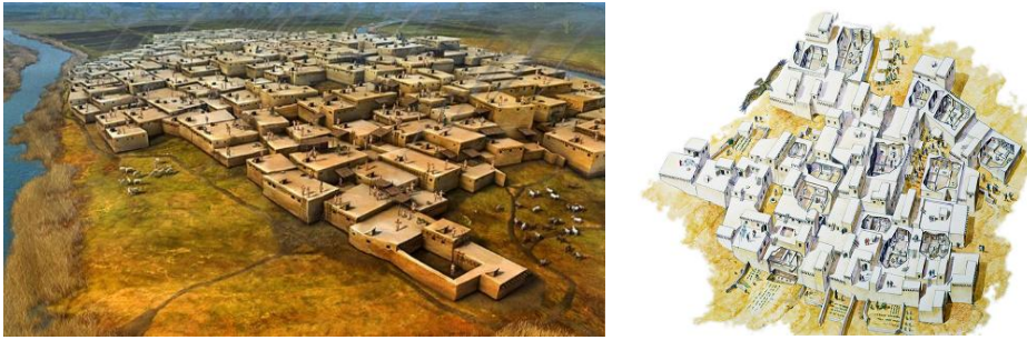
Görsel 3-4: Çatalhöyük Evlerini Gösteren Rekonstrüksiyon Çizim.

Çatalhöyük, 1958 yılında James Mellaart tarafından Konya Ovası'nda gerçekleştirilen yüzey araştırmaları sırasında keşfedilmiş ve 1961-1963 ile 1965 yıllarında kazı çalışmaları yapılmıştır. Ayrıca, 1993 yılından itibaren Profesör Ian Hodder liderliğindeki uluslararası bir arkeoloji ekibi tarafından yeni kazılar ve araştırmalar yürütülmektedir (Görsel 1-2), (Hodder, 2007). James Mellaart'ın 1960'lı yıllarda ortaya koyduğu Çatalhöyük yerleşimine ilişkin tabakalanma sistemine göre, yerleşim alanı farklı katmanlarda yer alan toplam on dört yapı katından oluşmaktadır. Çatalhöyük yerleşimi genel olarak üç tür mekândan oluşmaktadır; binalar, etrafı çevrili avlu benzeri açık alanlar ve sınırlandırılmamış açık alanlardır (Görsel 3-4). Sınırlandırılmamış açık alanlar, mahalleleri birbirinden ayıran sokaklardır (Hodder, 2014; Hodder, 2006; Düring, 2016; Mellaart, 2003).