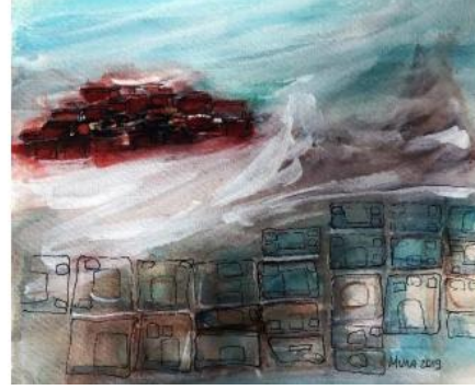
Görsel 14: Muna Silav, Çatalhöyük, Suluboya, 30x35 cm.

Sanatçı Ferit Cihat Sertkaya, Anadolu'daki Neolitik Dönem yerleşim merkezlerinde görülen dikdörtgen planlı mimari yapılardan ilham alarak oluşturduğu seramik çalışmalarıyla öne çıkmaktadır. Sanatçı, Görsel 15 ve 16'da yer alan çalışmalarında, plaka ve çimdikleme tekniklerini uygulayarak üç boyutlu çağdaş seramik formlar oluşturmaktadır (Sertkaya, 2019, s. 72-73).