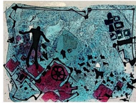
Görsel 11: Zeliha Kayahan, İnsanlar Âlemi Serisi, Karışık Teknik, 50 x 70 cm, 2020.