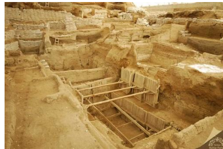
Görsel 1-2: Çatalhöyük Kazı Alanı.

Çatalhöyük yerleşkesi, Konya'nın güneydoğusunda, Çumra İlçesi'nin yaklaşık 11 km. kuzeyinde ve şehir merkezine 52 km. mesafede konumlanmaktadır. Yan yana bulunan iki höyükten oluşan bu yerleşim planının doğudaki kısmı Neolitik Çağa, batıdaki ise Kalkolitik Çağa tarihlendirilmektedir. Çumra Ovası'nı sulayan Çarşamba Çayı'nın kıyısına kurulan Çatalhöyük, yaklaşık 450x275 metre boyutlarında bir höyük olarak tanımlanmaktadır. Deniz seviyesinden 980