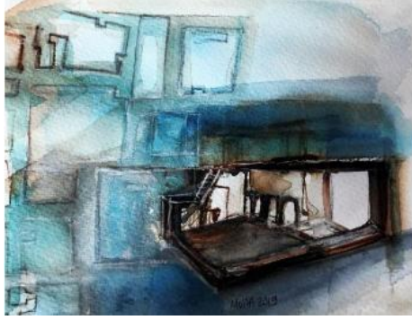
Görsel 13: Muna Silav, Çatalhöyük, Suluboya, 30x35 cm.

izlenimler, uygulanan suluboya tekniği ile ışık ve gölge oyunları kullanılarak resmedilmiştir (Çevik ve Silav, 2019, s. 14).