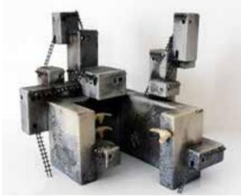
Görsel 15: Ferit Cihat Sertkaya, Form 1, Raku Pişirimi, 26x20x24 cm.

Sanatçı Ferit Cihat Sertkaya, Anadolu'daki Neolitik Dönem yerleşim merkezlerinde görülen dikdörtgen planlı mimari yapılardan ilham alarak oluşturduğu seramik çalışmalarıyla öne çıkmaktadır. Sanatçı, Görsel 15 ve 16'da yer alan çalışmalarında, plaka ve çimdikleme tekniklerini uygulayarak üç boyutlu çağdaş seramik formlar oluşturmaktadır (Sertkaya, 2019, s. 72-73).