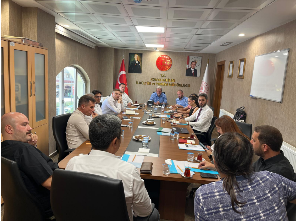
Şekil 1. İl Kültür ve Turizm Müdürlüğünde Gerçekleşen Paydaş Görüşmeleri