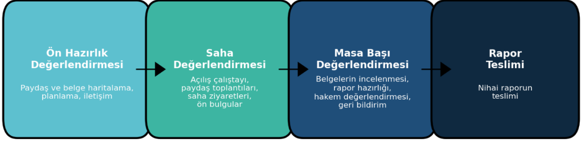
Şekil 4. Destinasyon Değerlendirme Süreci

Şekil 4'e göre, destinasyon değerlendirme süreci dört aşamada, aşağıdaki gibi açıklanmaktadır: