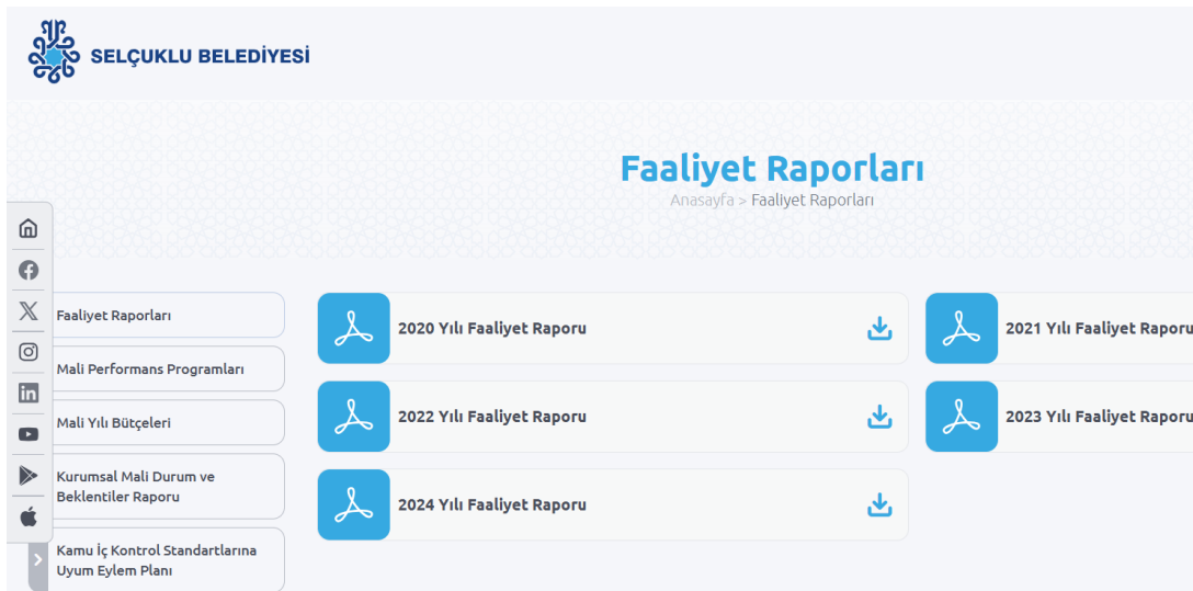
Şekil 8. Selçuklu Belediyesi faaliyet raporu

Su yönetiminde günlük numune alma, iletkenlik ölçümü ve kayıp-kaçak takibi gibi teknik izleme pratikleri yürütülmekte; il düzeyinde Sıfır Atık programları ve hava kalitesi izleme ağıları işletilmektedir. Ne var ki bu verilerin Sille özelinde turizmle bağlantılı, bütünsel ve kamuya açık bir yıllık sürdürülebilirlik raporu altında derlendiğine ilişkin kanıt bulunmamaktadır. Paydaş görüşmeleri taşıma kapasitesi çalışmasının henüz yapılmadığını ve ziyaretçi akışının yönetimine yönelik mekanizmaların eksik olduğunu teyit etmektedir. Ayrıca ziyaretçi ve yerel sakin geri bildirimlerinin düzenli ve temsili anketler yoluyla kurumsallaşmış biçimde toplanmadığı anlaşılmaktadır. Tüm bunlar ışığında Sille’de bazı alt bileşenlerde (ulaşım verileri, müze ziyaretçi sayıları, su kalite izlemesi) veri üretimi güçlü olmakla birlikte, GSTC A3 kapsamında beklenen gösterge-hedef seti, düzenli ölçüm-raporlama döngüsü ve periyodik gözden geçirme takviminin henüz tesis edilmediği görülmektedir.