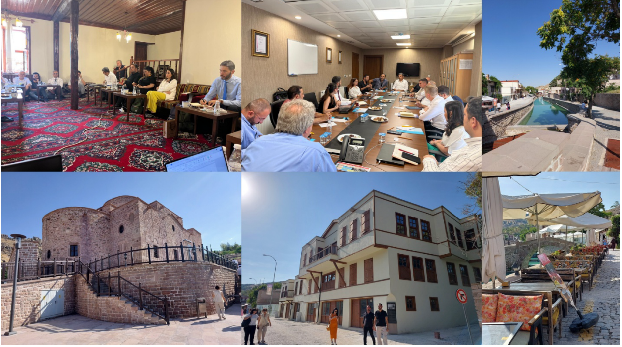
Şekil 5. Saha Ziyareti