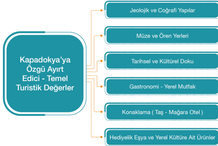
Şekil 3. Kapadokya'ya Özgü Ayırt Edici Turistik Özellikler

Bu çalışma ele alınırken tematik ve sektörel yaklaşım bir arada kullanılarak bütüncül bir planlama anlayışıyla hazırlıklar tamamlanmıştır. Tematik alanlar rekabetçilik, sürdürülebilirlik, destinasyon yönetimi (yönetişim), beşerî sermaye, girişimcilik ve yenilikçilik olarak belirlenmiştir. Sektörel olarak geliştirilmesi gereken alanlar ise doğal ve kültürel miras turizmi, alternatif turizm, güvenlik, ulaşım, tanıtım ve pazarlama olarak belirlenmiştir. Tematik alanlar sektöre ilişkin bileşenleri yatayda tamamen kesmekte ve sektörel dinamiklerle birlikte çalışmaktadır. Benzer şekilde sektörel alanlar tematik kavramlarla sürekli etkileşim içerisinde.